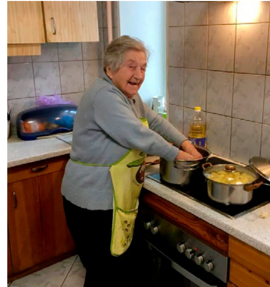
Maiga palīdz virtuvē

Nezūdīsimies, bet pateiksimies Dievam par visiem pārbaudījumiem, arī sāpēm!