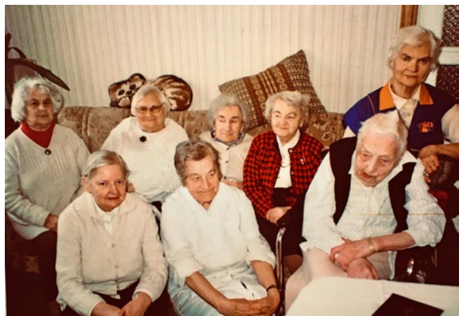
Maīga ar pensionāta iemītniecēm

Kādu rītu, apkopjot Emmiņu, konstatēju, ka radušies nopietni izgulējumi, taču šādam gadījumam nekā nebija pie rokas. Tā kā bija jārikojas ātri un paceltu viņu ilgi noturēt nevarēju, nomainīju tikai autiņus. Esmu medmāsa un labi zinu, cik izgulējumus grūti ārstēt. Nākamajai reizei sagatavoju visus nepieciešamos pārsienamos materiālus, bet, man par lielu pārsteigumu, tas nebija vajadzīgs – āda bija kļuvusi tīra, ne zīmes no jēlumiem. Man nebija liecinieku, bet es sapratu, ka Kungs šādi runāja uz mani: es neesmu nekas savā pārlicībā, bet Dievs var dziedināt un atbrīvot no sāpēm