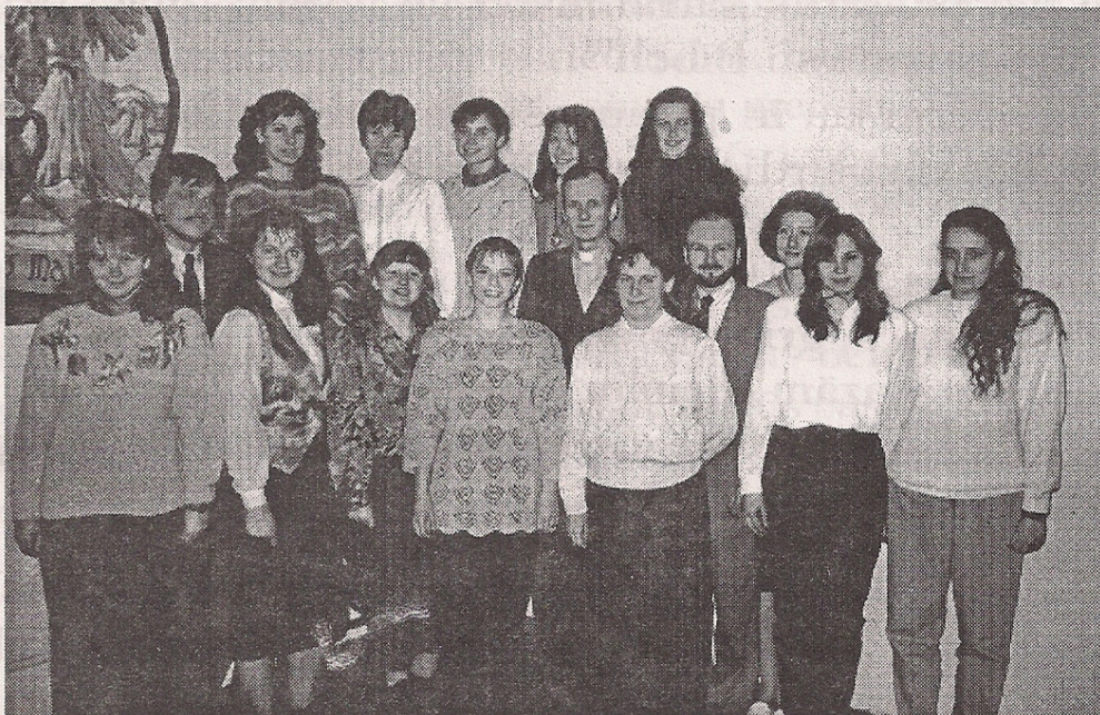
1995. mācību gada mūsu draudzes Svētdienas skolas skolotāji.