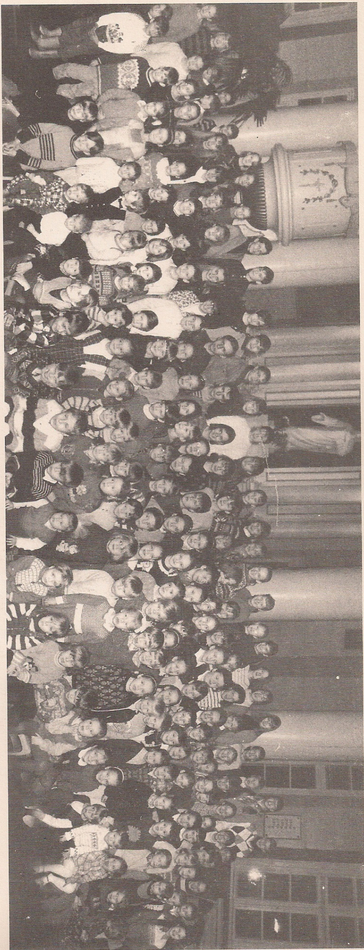
Desmit gadu laikā Svētdienas skolēnu skaits ir pieaudzis 15 reizes (1985. gadā - 16 bērni; 1995. gadā 250 bērni).